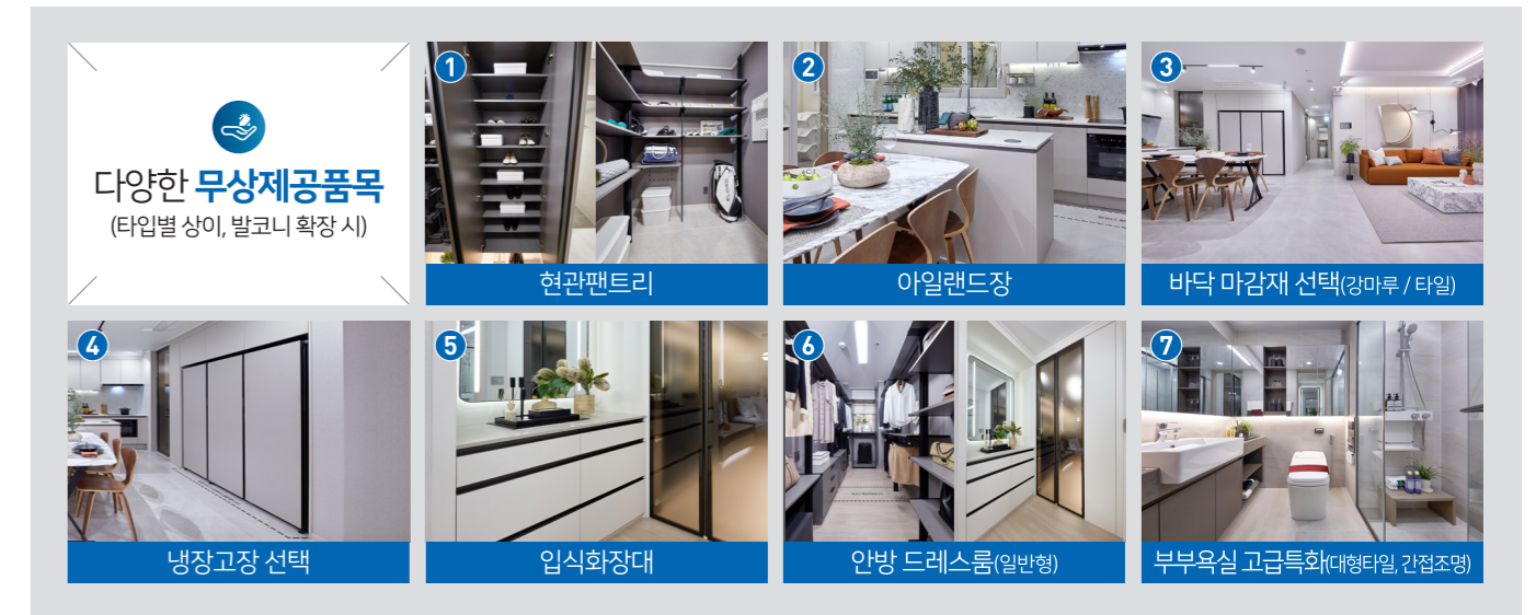
※ 상기 무상제공품목은 발코니 확장 시에만 제공되며 비확장시에는 제공되지 않습니다.

■ 상기 세대의 평면, 면적, 색상 등은 실제 시공 시 다소 차이가 있을 수 있으며, 확장 여부에 따라 일부 마감재 및 시공의 차이가 있을 수 있습니다. ■ 상기 평면도는 소비자의 이해를 돕기 위한 것으로 정확한 내용은 견본주택에 비치된 설계도서를 반드시 확인하시기 바랍니다. ■ 상기 평면도는 동일 주택형이라도 단지별, 세대별로 계단 및 공용 면적 등이 차이가 있으므로 자세한 사항은 견본주택에서 확인하시기 바랍니다. ■ 발코니 확장 시 세대별로 단열재의 위치, 벽체의 두께, 세대간 마감 등이 상이할 수 있으며, 확장 부위는 직접 외기에 면해 상대적으로 단열성능 및 결로에 취약할 수 있습니다. ■ 안방 발코니 및 돌출형발코니에 선통통 및 트레이닝 시공되어 소음이 발생할 수 있습니다. ■ 상기 무상제공품목 이미지는 소비자의 이해를 돕기 위한 이미지로 추가선택품목 및 전시품목이 포함되어 있습니다. ■ 자세한 내용은 모집공고 및 견본주택POP, 안내사항 등을 참고하시어 착오없이 주시기 바랍니다. ■ 부부욕실 고급특화(대형타일, 간접조명)